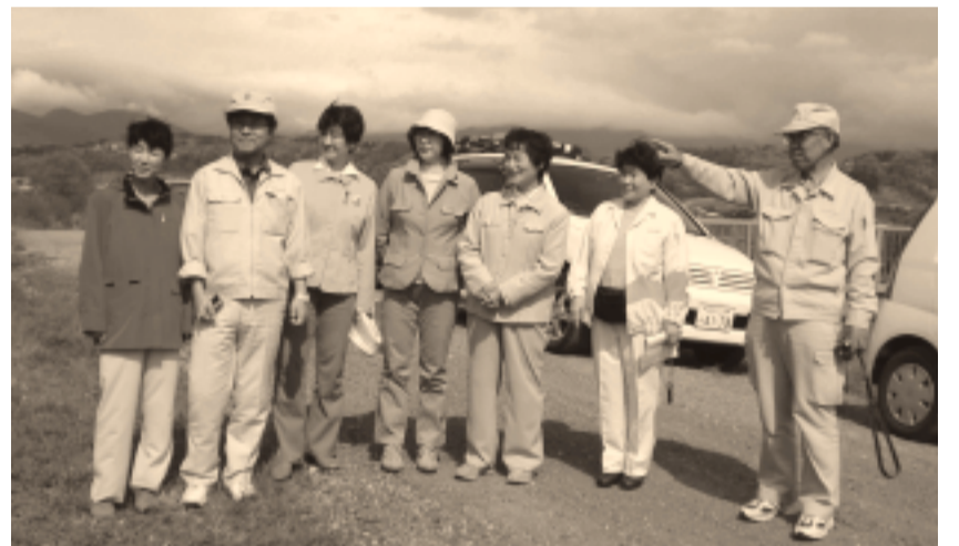
千曲川を、下流の飯山から浅川合流地点までさかのぼって調査しました。（5月2日）