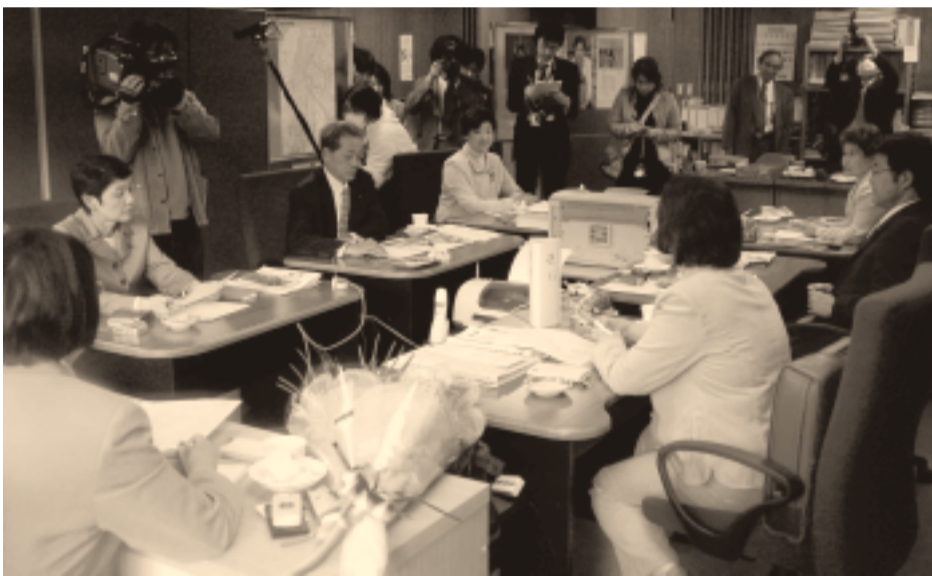
初回会議に取材陣も殺到（4月9日）

国会で成立した憲法改悪手続法（国民投票法）に抗議し、平和と暮らしを守るため、また、差し迫った浅川の穴あきダム建設をやめさせる取り組みをはじめ、公約実現のため、力をあわせてがんばります。いっそうのご支援をお願いいたします。