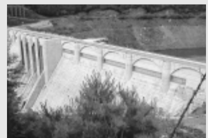
完成後の試験湛水で地すべりが発生、集落ごと移転の事態になった大滝ダム

日本共産党県議団、同長野市議団から、浅川の河川整備計画案と関連して、日本で唯一の「穴あき」ダム・益田川ダム、地すべり地につくられた大滝ダムの視察報告をします。県議会、市議会のとりくみ、当局の対応など、一連の流れについても報告します。