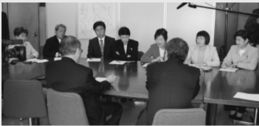
土木部長に申し入れ（4月11日）

4月11日にはさっそく7名の県議全員で、長野市浅川の「穴あきダム」の中止と、浅川河川整備計画案の住民説明の徹底などを求めて、土木部長に申し入れを行いました。